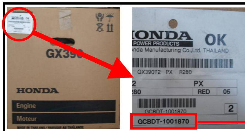
外包裝紙箱上的引擎號碼