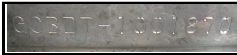
引擎上的引擎號碼